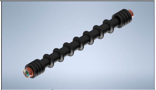
SẢN PHẨM: CON LĂN LÀM SẠCH